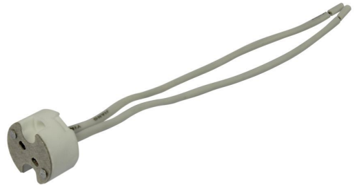
GX5.3 (12V) Sockel